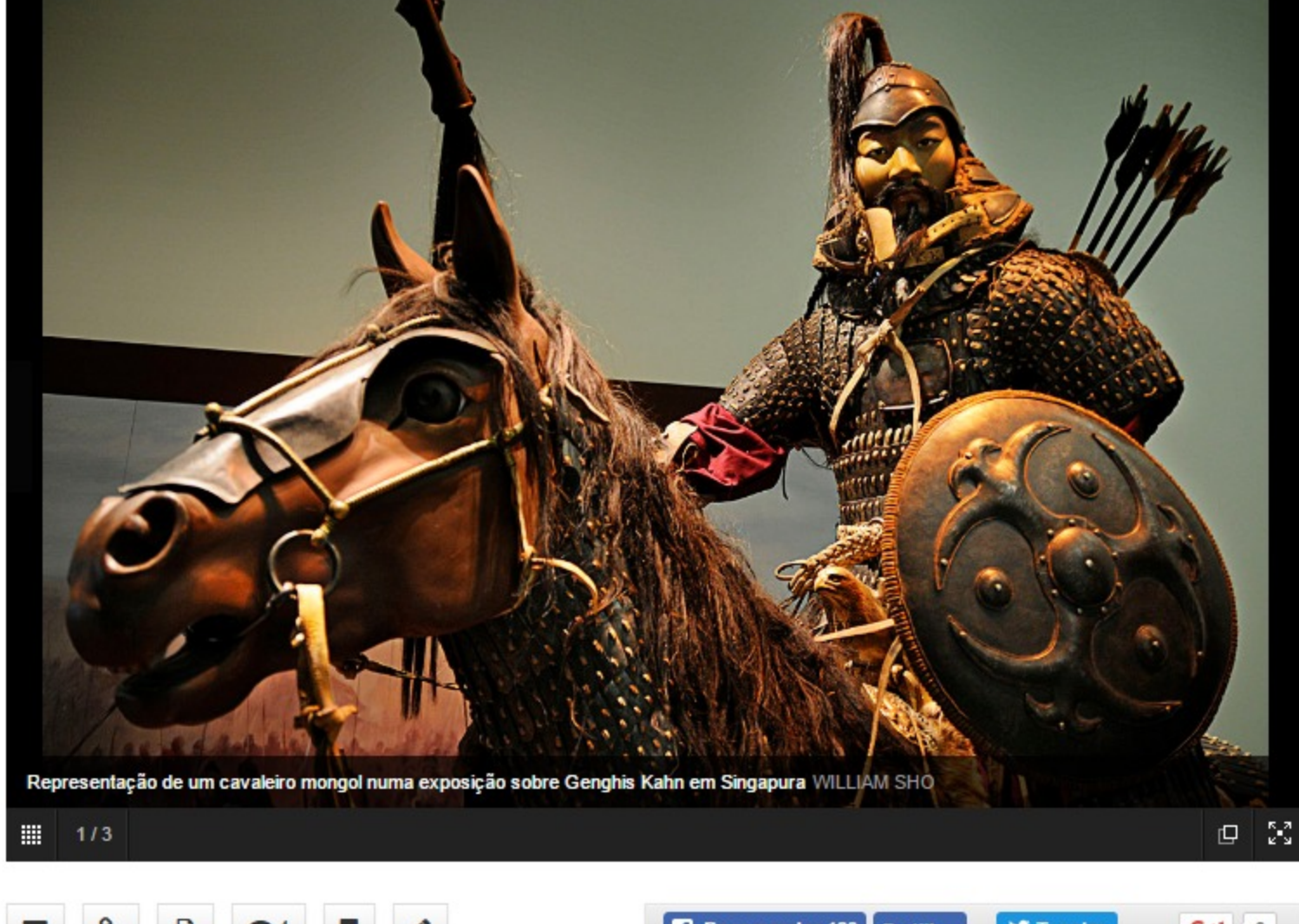
Representação de um cavaleiro mongol numa exposição sobre Genghis Kahn em Singapura WILLIAM SHO

Ficou gravado nos anéis de crescimento das árvores: no início de 1242, o Inverno foi muito rude na Hungria. Uma análise deste “arquivo natural” do clima poderá explicar em parte um velho mistério histórico: a razão pela qual o Império Mongol nunca se expandiu para a Europa Ocidental.