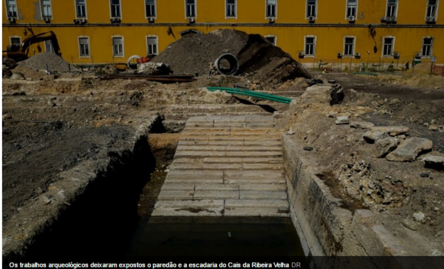
Os trabalhos arqueológicos deixaram expostos o paredão e a escadaria do Cais da Ribeira Velha

Neste ponto da frente ribeirinha de Lisboa foram também descobertos "restos das paredes, muito destruídas" do Forte da Ribeira. O subsolo escondia ainda vestígios dos séculos XVI e XV, como cerâmicas italianas e sementes.